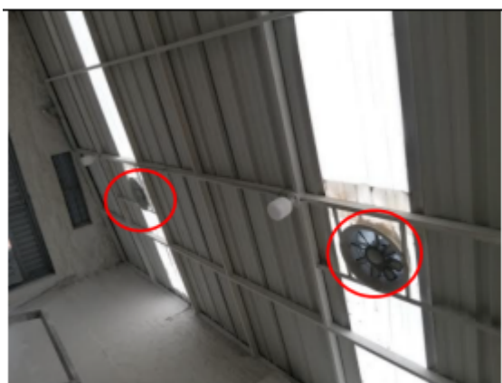
Fotografía No. 5 Sistemas de extracción.